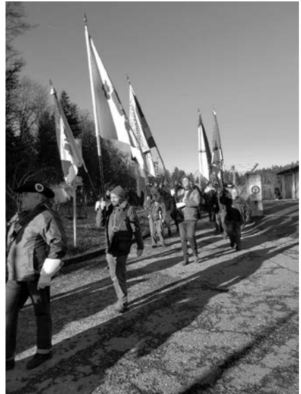
Marsch mit der Fahne zum Fässlihalt